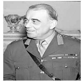
Hastings Lionel Ismay (Sekretarz Generalny NATO 1952-57, brytyjski dyplomata)

(Rosjan trzymać z daleka, Amerykanów blisko, a Niemców pod kontrolą)